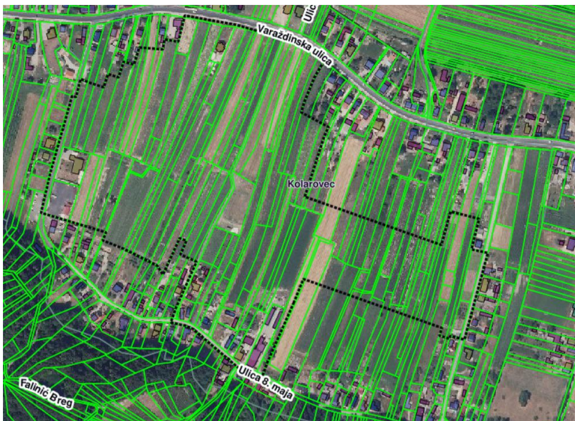
Prikaz 1 Obuhvat UPU preuzet iz ISPU sustava – ePlanovi, Geometrija plana, na DGU podlogama

Područjem dijelom prolazi javna cesta LC25004 / Brezje Dravsko (DC2) - Mali Lovrečan (ŽC2027), koja je ujedno Ulica 8. maja.