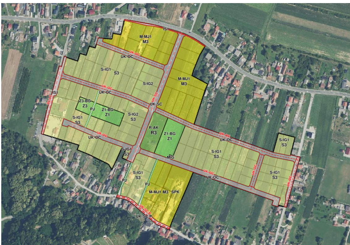
Prikaz 3 Rješenje namjene površina i pravila provedbe s prijedlogom (neobavezne) parcelacije

Za pojedine površine pravila provedbe, kao primjerice za ulične koridore, čestice nisu posebno iskazivane.