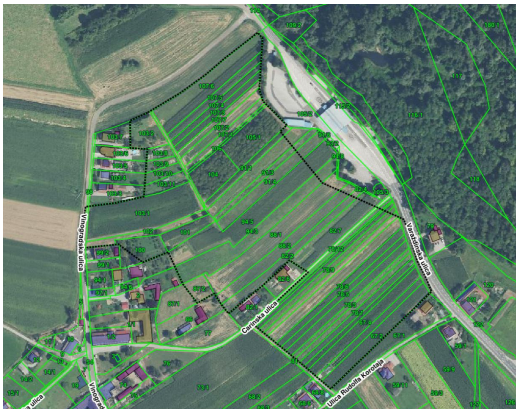
Prikaz 1 Obuhvat UPU preuzet iz ISPU sustava – ePlanovi, Geometrija plana, na DGU podlogama