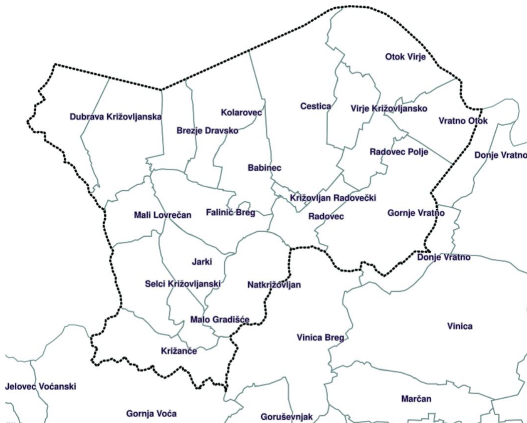
Prikaz 2 Prikaz naselja unutar Općine Cestica, ISPU sustav

Natkrižovljan, Otok Virje, Radovec, Radovec Polje, Selci Križovljanski, Veliki Lovrečan, Virje Križovljansko i Vratno Otok.