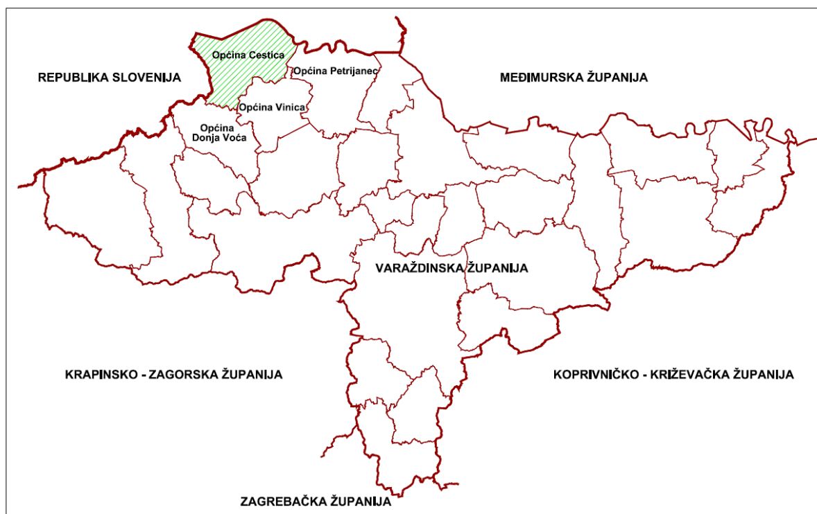
Prikaz 1 Općine u odnosu na Varaždinsku županiju

Općina Cestica se nalazi u sjevernom dijelu Varaždinske županije.